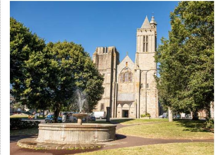
Dol-de-Bretagne - Cathédrale Saint Samson