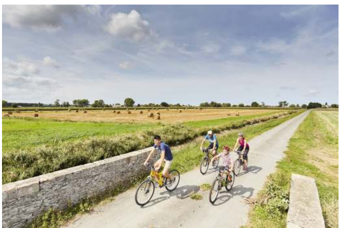
Le Marais Blanc