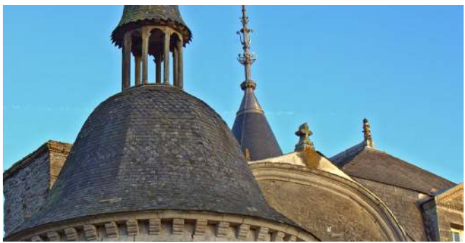
Château de La Bourbansais - Pleugueneuc

La boucle présente de belles demeures, témoins de la richesse patrimoniale de la région. Au départ de Saint-Domineuc, après avoir flâné sur les berges du canal, de jolies maisons en terre jalonnent votre itinéraire. Tréverien est une escale sur le canal avec ses berges aménagées. Pour les moins courageux, une liaison intermédiaire permet de rejoindre directement le point de départ en suivant la voie verte le long du canal d'Ille-et-Rance. Vous rejoindrez enfin Pleugueneuc, où le Domaine de La Bourbansais fera le bonheur des petits et des grands !