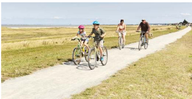
Baie du Mont-Saint-Michel

Au départ de Pleine-Fougères, le circuit vous emmène à la découverte de la campagne de la Baie, son bocage et son patrimoine architectural très riche. Les points de vues dominent tantôt la plaine, tantôt la Baie et les villages de Broualan et Trans-la-Forêt présentent leurs atouts architecturaux : églises, maisons en granit, calvaires... On apprécie ici le calme de la campagne et de ses hameaux. Une balade champêtre !