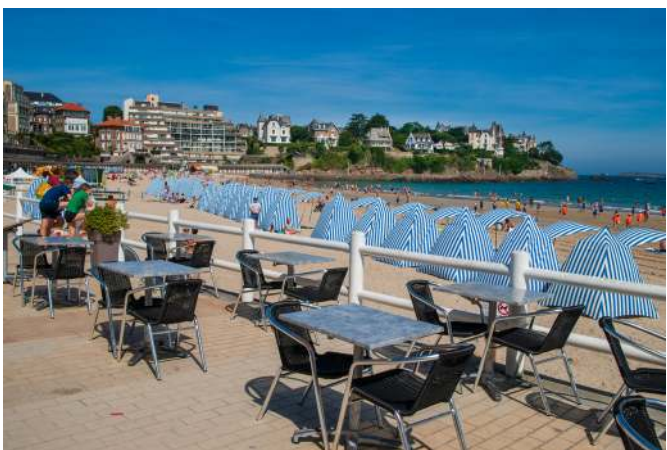
Plage de l'Écluse - Dinard

Ce joli circuit démarre Place de la Mairie à Saint-Jouan-des-Guérets. Il vous emmène sur les bords de Rance et offre de beaux points de vue sur les îles Harteau et Chevret. Un arrêt s'impose à la Malouinière du Bos (privée) dont les jardins se visitent en saison. De belles chaumières restaurées se découvrent aussi au fil de la balade. Le village de Saint-Père-Marc en Poulet invite à une halte sur la place de l'église. Le retour vous entraîne vers les anciens moulins à marée de Beauchet et de Quinard.