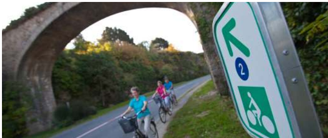
Saint-Briac sur Mer