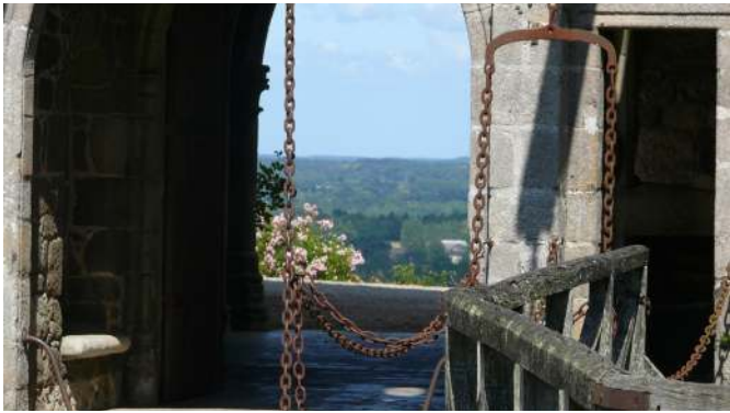
Château de Montmuran - Les Iffs

Le circuit débute à Saint-Domineuc, escale sur le Canal d'Ille-et-Rance, véritable colonne vertébrale du pays, construit à l'ère napoléonienne (fin 19 e siècle) pour faciliter la navigation marchande en reliant La Manche à l'Océan pour la navigation marchande. Le chemin de halage aménagé en voie verte invite à la balade et à la flânerie. L'escale de Tinténac vous propose de faire une pause au Musée de l'outil et des métiers anciens avant de rejoindre Québric où son clocher ne manque pas d'originalité !