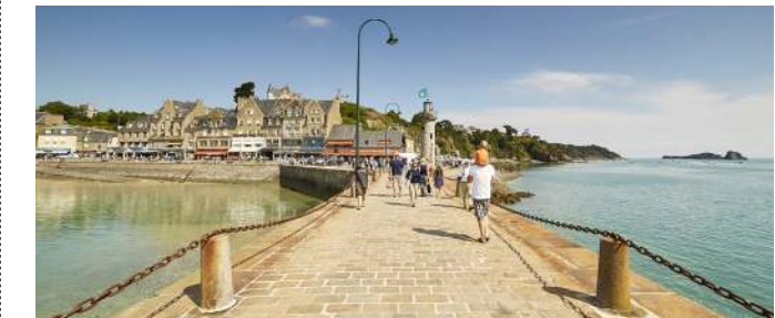
Cancale - Port de La Houle

Au départ du centre, empruntant chemins et petites routes, le circuit vous emmène à la découverte des villages de Cancale, en passant par Port Mer et son joli front de mer et jusqu'à la Pointe du Grouin. Le site, classé Espace Naturel sensible, mérite une halte ! Point de vue sur le Mont Saint-Michel et l'île des Landes et sa réserve d'oiseaux. Retour par la campagne cancalaise et la route de la Corniche jusqu'au port de La Houle. Belle montée pour terminer !